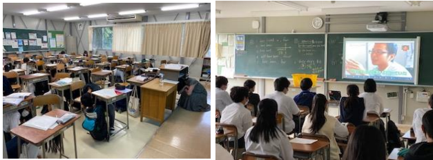
6/30(水)避難訓練「自助、防災交流ビデオ視聴」

高等学校に通学している生徒の地域は多岐にわたっていることが多く生徒は様々な通学方法で学校に通っています。各自が居住地から学校所在地域等の気象情報や交通機関情報などの収集に努め、身の安全を最優先して行動してください。最も重要なことは、危険な状態で無理をしないことです。今回の変更・追加点をご家庭で確認して、安全第一の通学をお願いします。